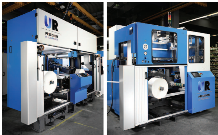
Abwickler (links) und Aufwickler – jeweils mit geöffneter Tür.